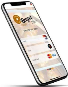
Page de paiement en ligne