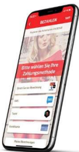
Intégré dans l'application